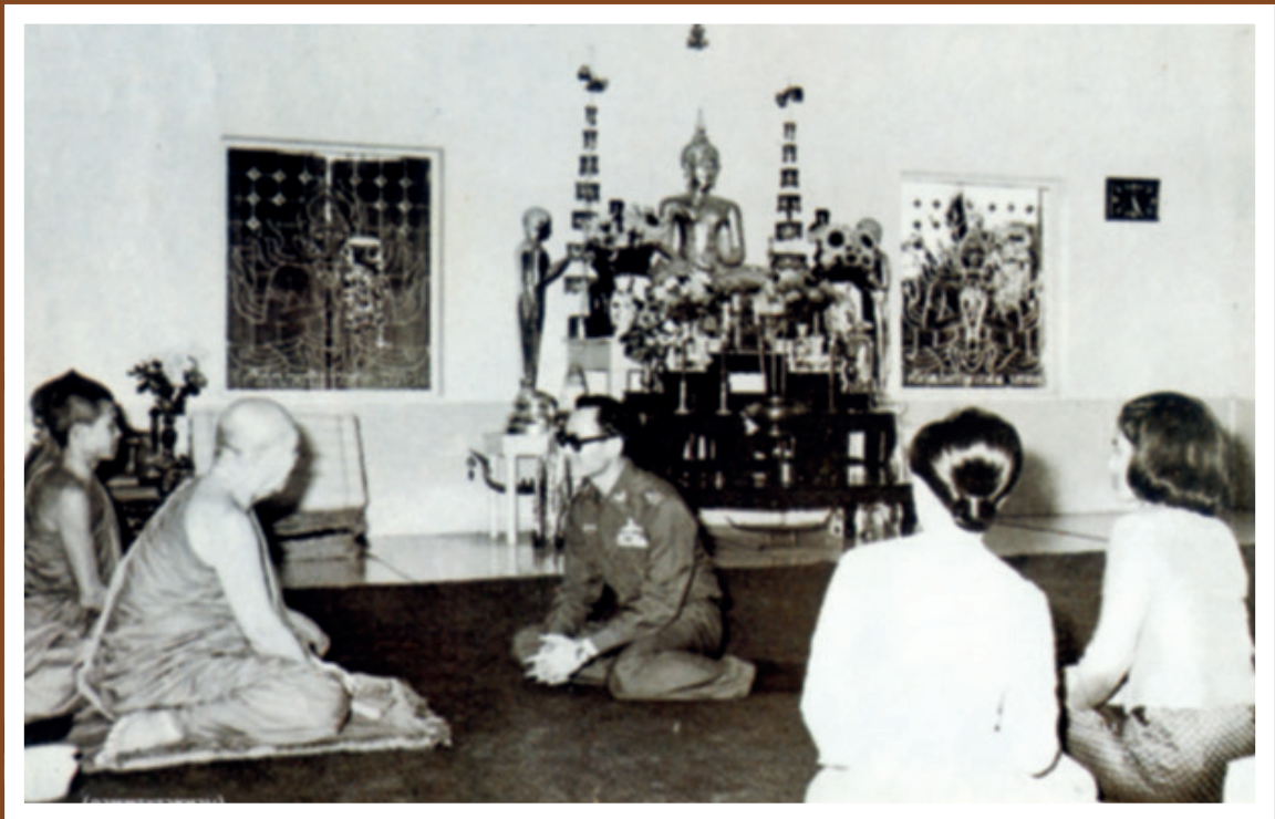
พระอาจารย์ หลวงปู่ฝั้น พระบาทสมเด็จพระปรมินทรมหาภูมิพลอดุลยเดช รัชกาลที่ ๙